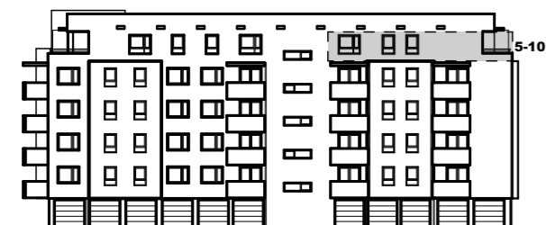
PRIKAZ STANA NA JUGOISTOČNOM PROČELJU