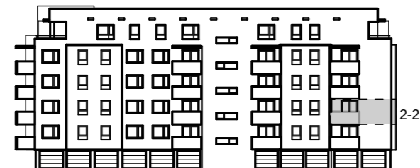
PRIKAZ STANA NA JUGOISTOČNOM PROČELJU