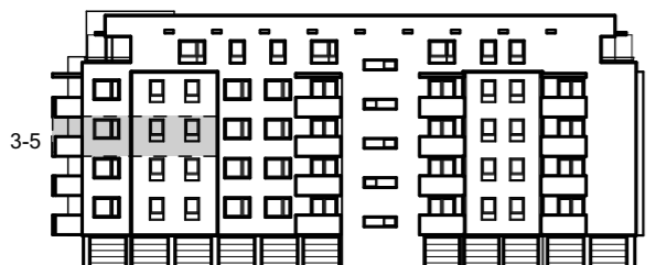
PRIKAZ STANA NA JUGOISTOČNOM PROČELJU