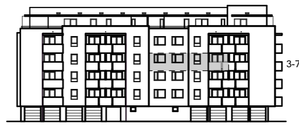
PRIKAZ STANA NA SJEVEROZAPADNOM PROČELJU