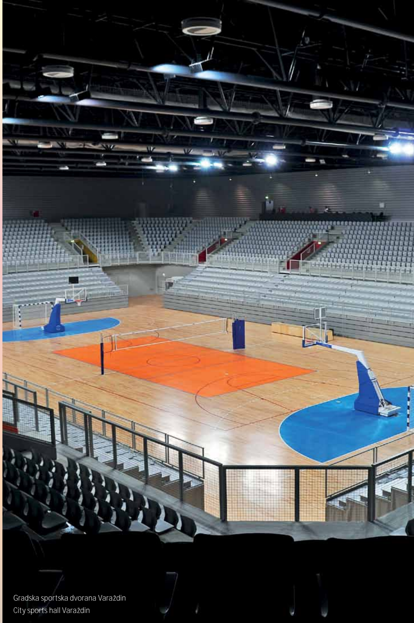
Gradska sportska dvorana Varaždin City sports hall Varaždin

Zagorje-Tehnobeton d.d. kontinuirano sudjeluje u realizaciji Vladinih projekata izgradnje autocesta, škola, bolnica i elektrodistributivnog sustava.